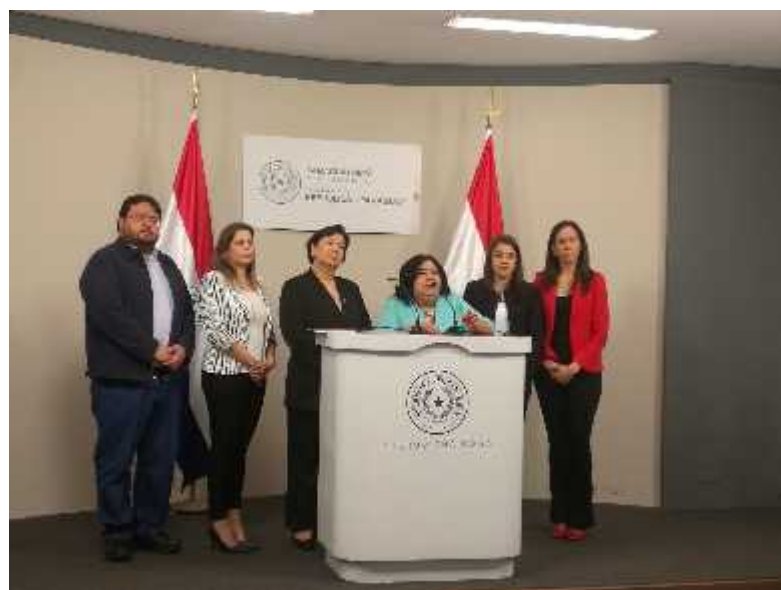
Conferencia de prensa en Mburuvicha Róga